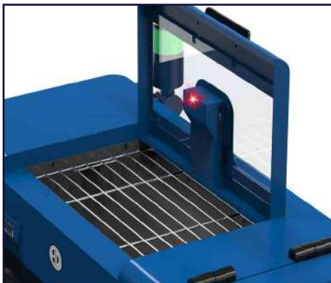
Alarma por falta de polvo