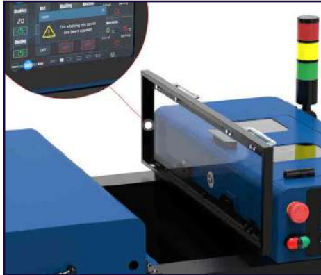
Protección por apertura de tapa