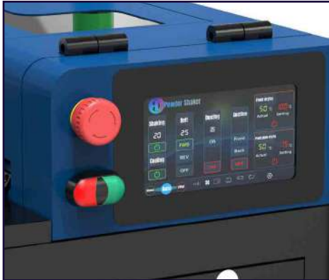
Pantalla táctil mejorada