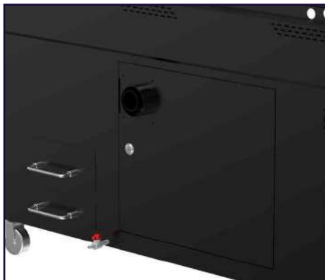
Sistema de filtrado de humo incorporado