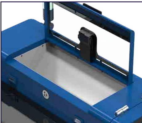
Alarma por falta de polvo