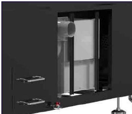
Sistema de filtrado de humo incorporado