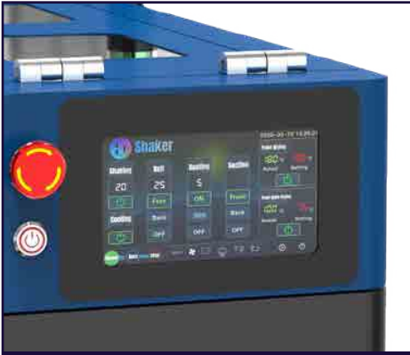
Pantalla táctil mejorada