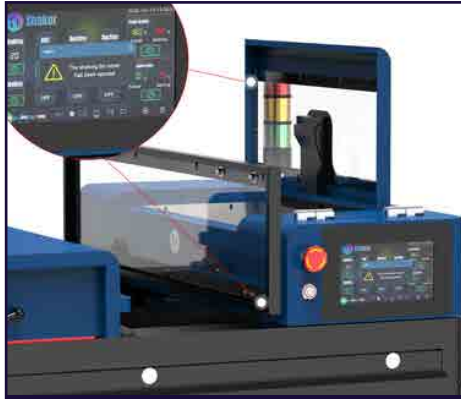
Protección por apertura de tapa