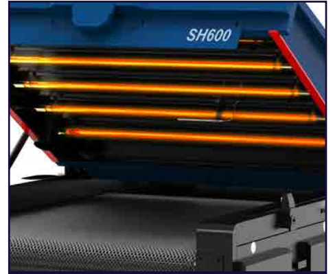
Calentamiento con lámparas mejorado