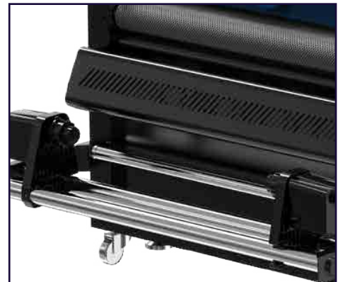
Sistema de recolección con doble motor