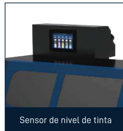
Sensor de nivel de tinta