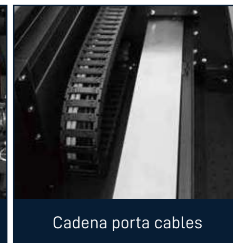
Cadena porta cables