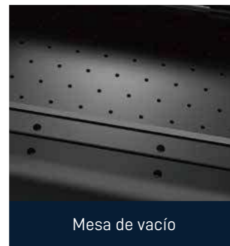
Mesa de vacío