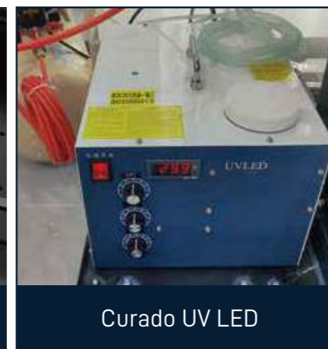
Curado UV LED