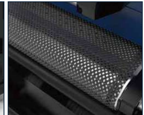
Cinta transportadora con control de potencia