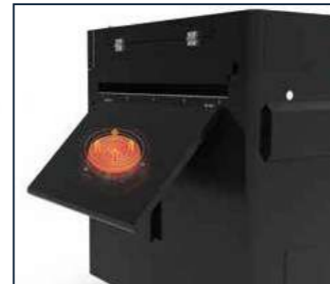
Sistema de calentamiento frontal ultrarrápido