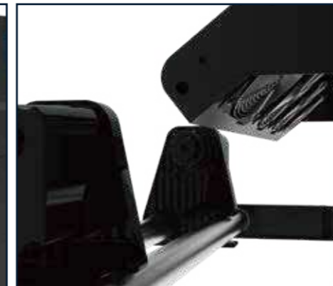
Sistema de ventilación con enfriamiento por aire