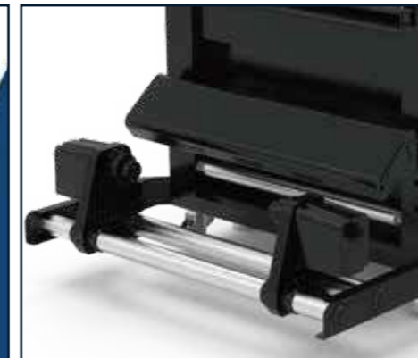
Sistema de alimentación de papel con doble potencia