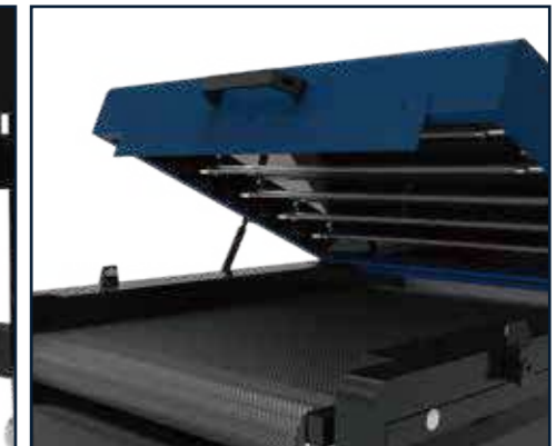
Sistema de curado y secado superior