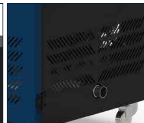
Entrada para capturar humo de manera efectiva