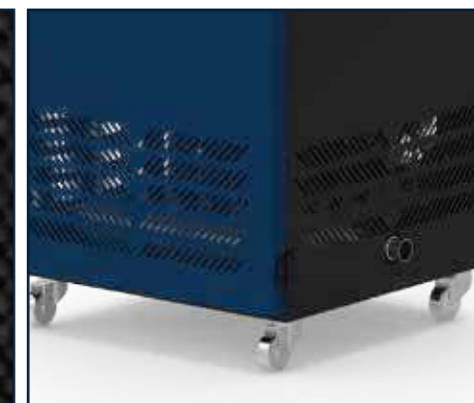
Ruedas universales para una movilidad sencilla y práctica