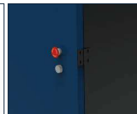
Interruptor principal y regulación del flujo de aire