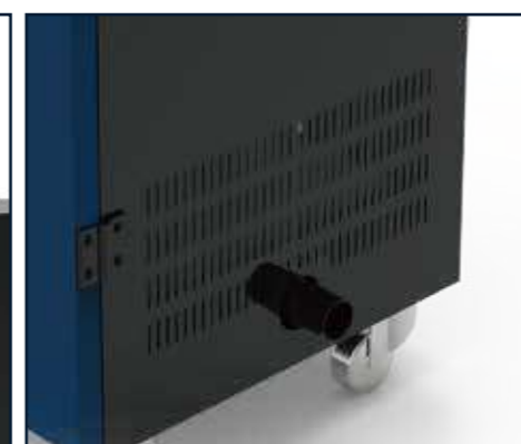
Entrada para capturar humo de manera efectiva