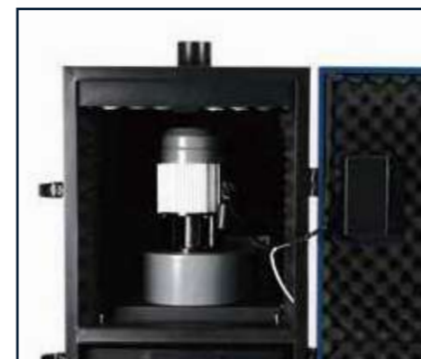
Sistema de extracción para máxima eficiencia