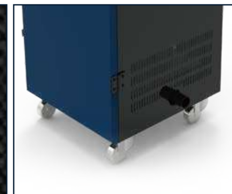
Ruedas universales para una movilidad sencilla y práctica