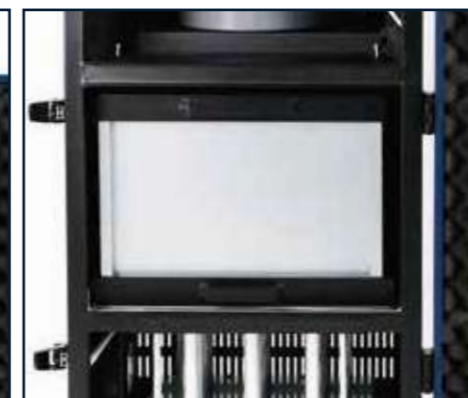
Tecnología de filtrado óptimo para un ambiente limpio