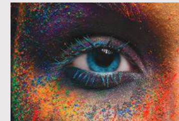
Sistema de recuperación de boquillas

Se monitorea automáticamente el funcionamiento de los cabezales y se identifican las boquillas bloqueadas.