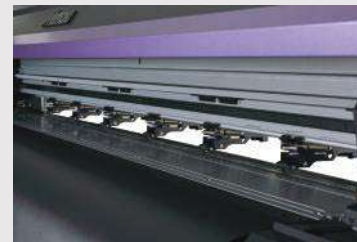
Rodillos de presión avanzados

Duplica la vibrancia de la paleta de colores corporativos y el detalle nítido de la fotografía con facilidad.